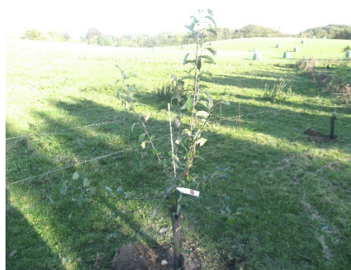
8/10-17 Rød Gråsten