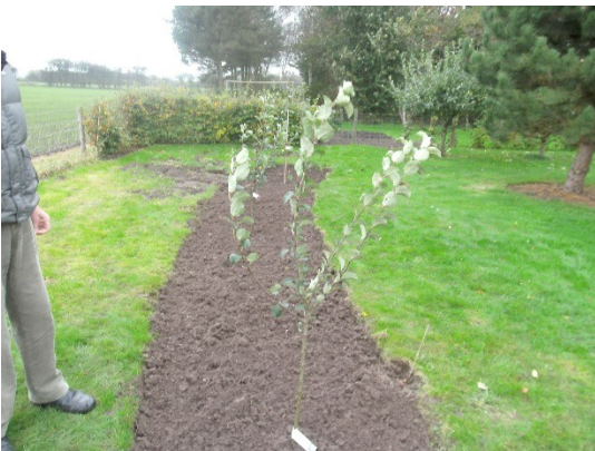
24/10 17 Filippa