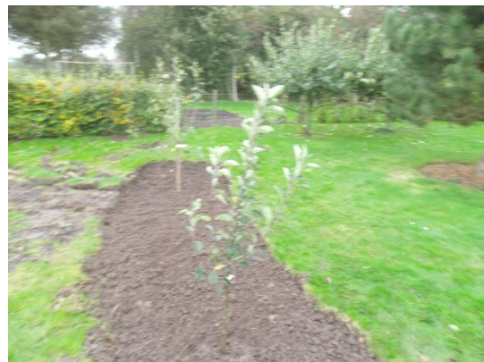
24/10 17 Discovery