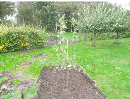
24/10 17 Belle de Boskoop