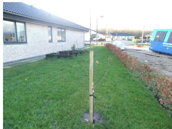
Filippa 25/11 17